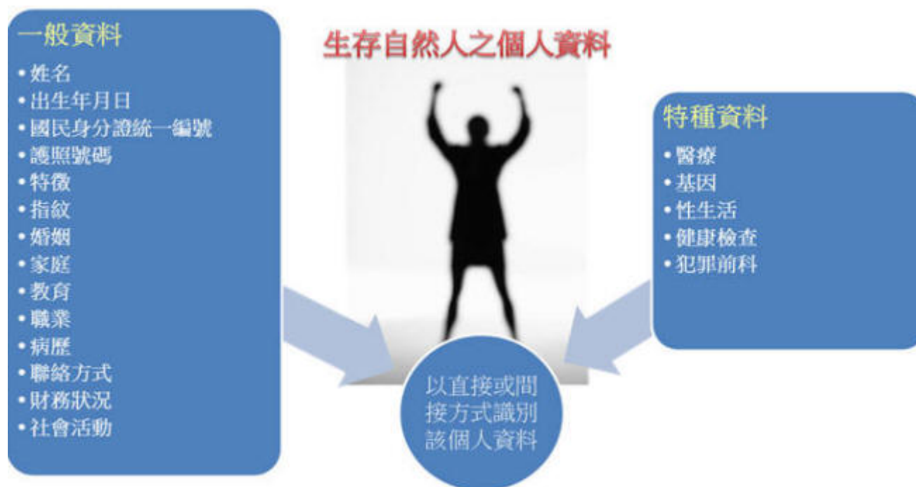
圖一：個資法所稱之個人資料

個資法主要從蒐集、處理和利用等三個層面，來規範個人資料的合理利用，新個資法所保護的資料型態，也從原本的電腦處理之個人資料，延伸到無論是電腦處理的數位個人資料，或是紙本的個人資料，皆適用於直接或間接識別之個人資料中。